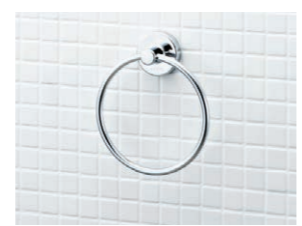
スタンダードシリーズ タオルリング KF-91