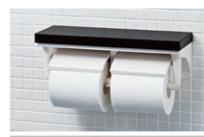
カラーバリエーション □ WA □ LP □ LL □ LM □ LD CF-AA64KU