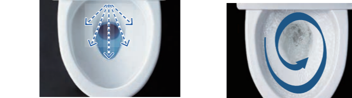
*写真はイメージです。便器形状により塗布範囲が異なる場合があります。