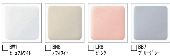
□ BW1 ホワイト □ BN8 オリーブ □ LR8 ピンク □ BB7 ブルーグレー